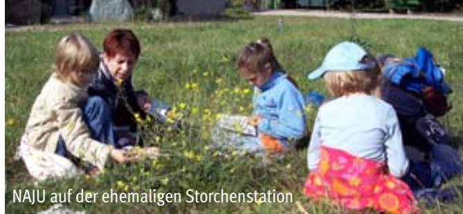
NAJU auf der ehemaligen Storchenstation