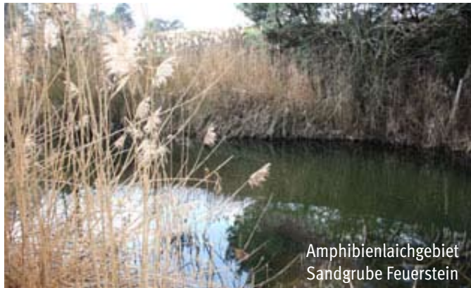
Amphibienlaichgebiet Sandgrube Feuerstein

Ein »Highlight« ist unser »Tag der offenen Tür« an der Sandgrube Feuerstein. Diese ehemalige Sandgrube ist ein Amphibienlaichgebiet und ein Biotop für seltene Tier- und Pflanzenarten.