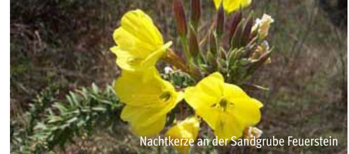
Nachtkerze an der Sandgrube Feuerstein