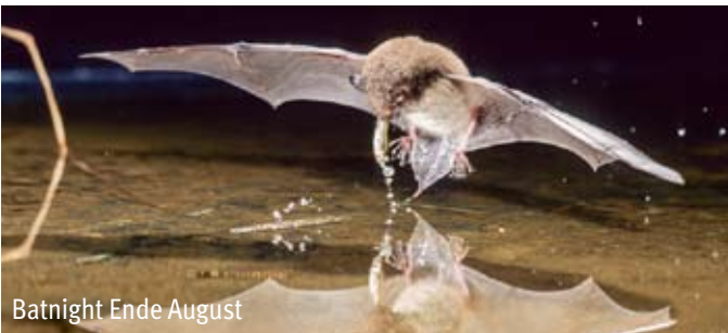
Batnight Ende August

Zu unserer Arbeit gehört der Vogel-, Amphibien- und Fledermausschutz: Z. B. Nistkastenbetreuung im Lampertheimer Wald und Fledermausveranstaltungen für Familien am Altrhein. Botanische und ornithologische Führungen werden in unserem jährlichen Veranstaltungskalender angeboten, ebenso kostenlose naturpädagogische Aktionen für lokale Kindergarten- und Grundschulgruppen. Wir betreuen auch Langzeitprojekte wie z.B. Schulgärten.